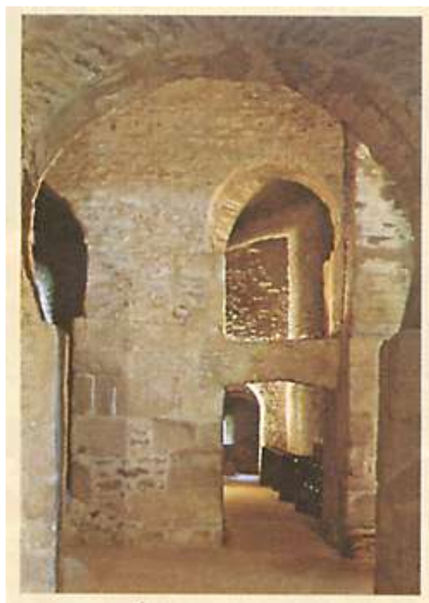
Interno de la preĝejo. Xa jarcento.