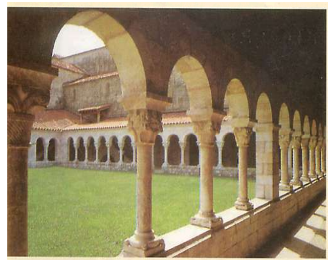
Klostro de la XIIa jarcento.